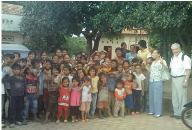
Orphelinat de Kon Klor (50 enfants)

KHANH HOA : une école maternelle de 80 enfants répartis en 3 établissements à Khánh Vĩnh, un village isolé à 30 km de Nha Trang. L'école a reçu 2 balançoires, deux radios-lecteurs de CD et les enfants ont reçu du matériel scolaire et des friandises