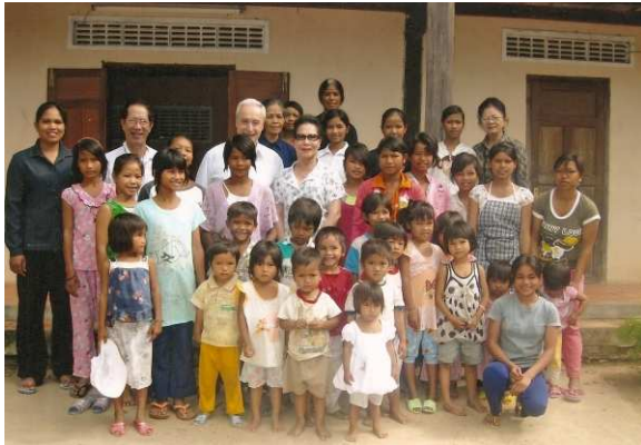
Orphelinat de Kon Doxing (50 enfants)

KONTUM : 2 orphelinats à Kon Doxing et Kon Klor ENFANCE-AVENIR a apporté à chaque enfant du riz, des pâtes, des biscuits, des friandises, des chaussures, du matériel scolaire et 50.000 VND (2€)